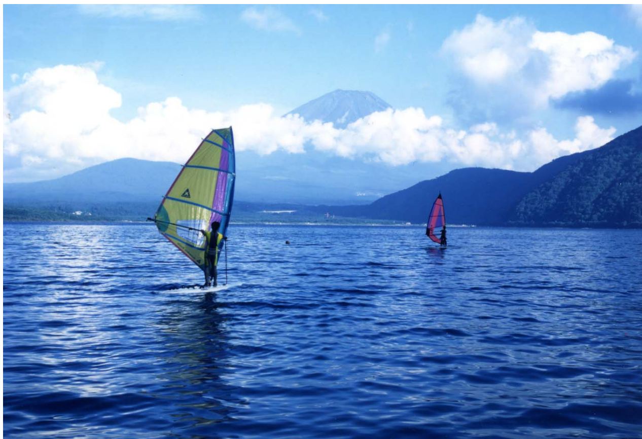
本栖湖・ウインドサーフィン